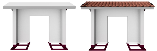
製造躯体 屋根材の種類によって 和洋どちらの外構にも調和します。 屋根レイヤーを表示すると 洋瓦（イメージ）が現れます。 ※瓦工事は工事店様手配となります。